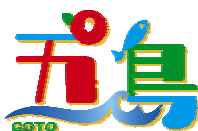
五島市の統一 ロゴマークです。