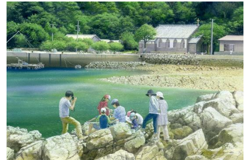
旧五輪教会のスケッチ会©山本二三

雄大な自然や歴史的・文化的建造物、環境音が聞こえてきそうな風景、路地など、多岐にわたり緻密に描かれています。お近くにお住まいの方はぜひこの機会に会場でお楽しみください。