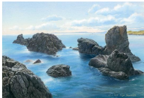
野々切のマチオ©山本二三