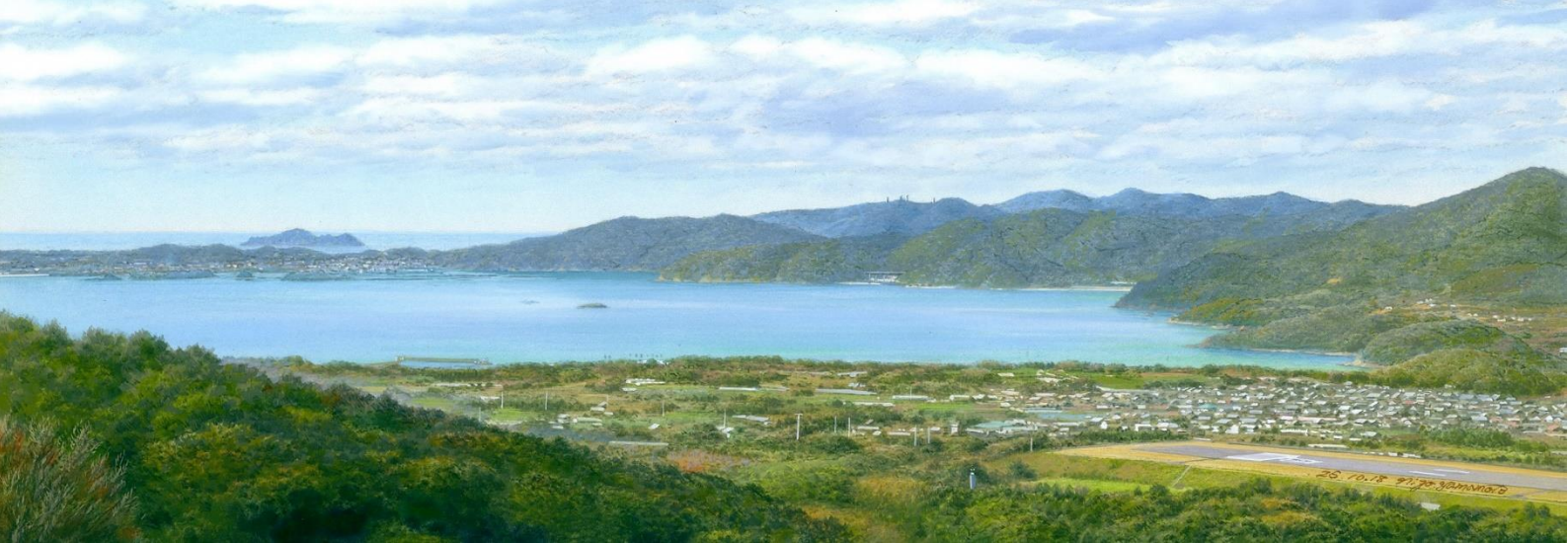
鬼岳から臨む野々切©山本二三