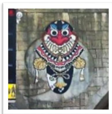
トンネルレリーフ

五島には、「バラモン」以外にも、「鬼」「椿」といった名の付くお店や商品が多くあります。皆さんの郷土愛が伺えますね。五島を訪れた際には、ぜひ探してみてください。