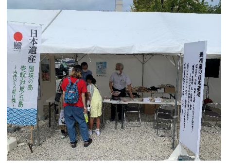
日本遺産ブースの様子(中央・右)