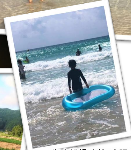
海水浴場はどこも賑やかな声があふれていました。