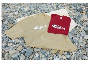
オリジナルTシャツ