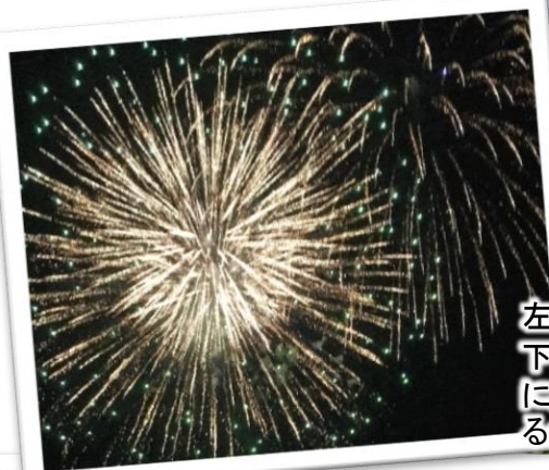
左: 富江の花火。 下: 三井楽の花火。クライマックスに目の前いっぱい に広がる花火は見事でしたが、盛り上がりに合わせて るかのように大雨が.....。

<8月24日現在> 五島市心のふるさと市民 22,337人 22,222人突破！