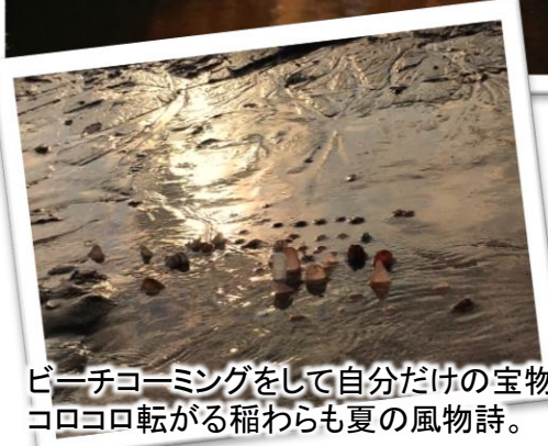
ビーチコーミングをして自分だけの宝物に。 コロコロ転がる稲わらも夏の風物詩。