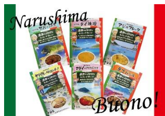
漁師のイタリアン