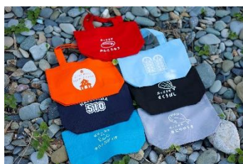
オリジナルトートバッグ