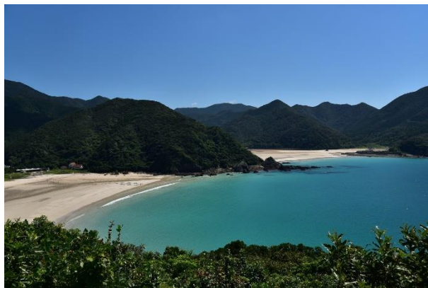
←高浜・頓泊海水浴場

夏といえば海。海といえば五島ですね! 五島では、主な海水浴場が16日一斉にオープンし、島が最もにぎわう夏の行楽シーズンが始まりました。楽しく安全な夏となりますように。