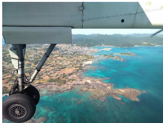
右／魚津ヶ崎公園 上／飛行機から望む富江半島