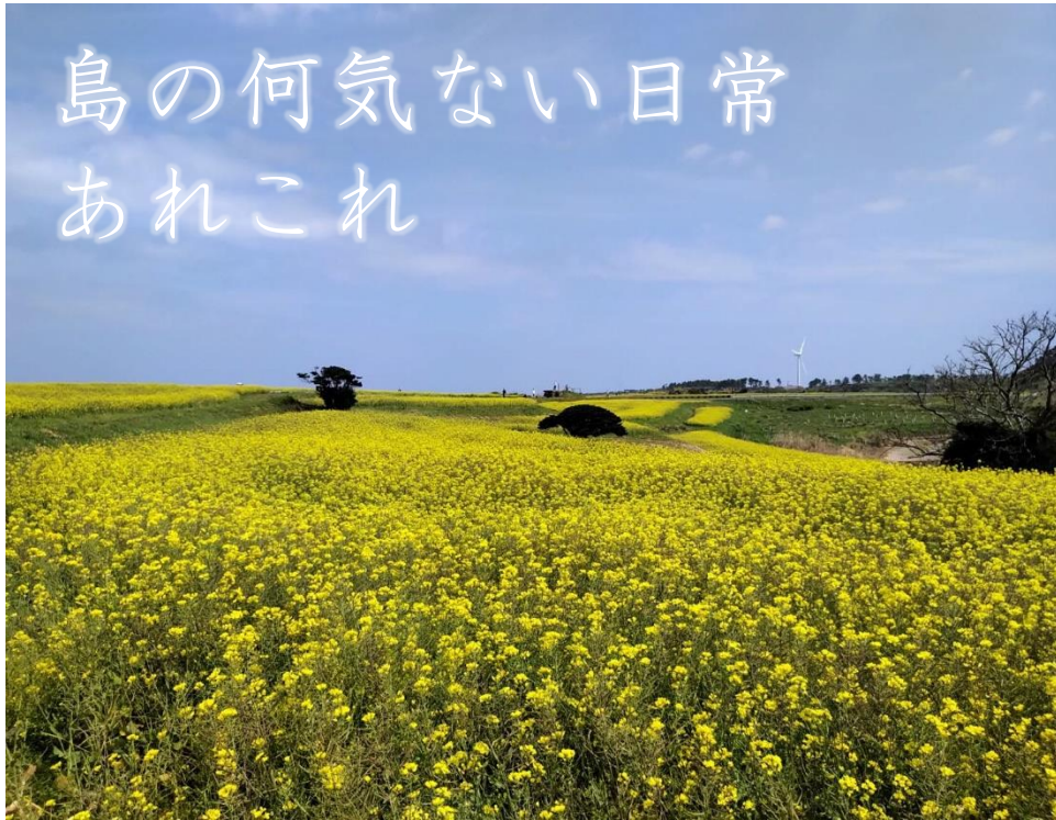
春の魚津ヶ崎公園では一面の菜の花が楽しめる。