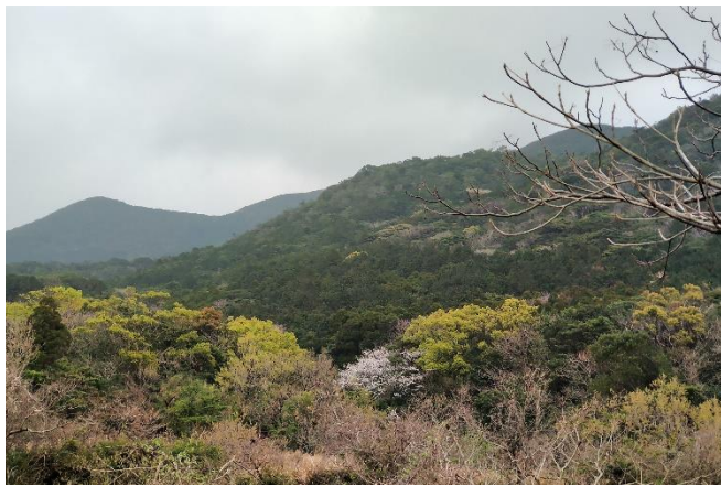
上／冬とは違う色を見せる山

市内のあちこちの赤い椿の花が落ち始め、菜の花のビビットな黄色が目立つようになって一気に春めいてきます。先日、山にチラチラと白や桃色が混じり始めたと思ったら、あっという間に山桜は花を散らし、葉桜へとなりつつあります。 この時期は椿に菜の花、桜にツツジと花が次々に咲くため、タイミングが良ければ、冬の花と春の花のコラボレーションを楽しむこともできます。 自然が作り出す風景は状況でがらりと変わるので、似たような風景でも毎回違う発見と感動がありますね。