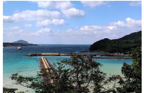
上／新しい五島市立図書館 下／打折峠からの眺め。奥に姫島が見える。