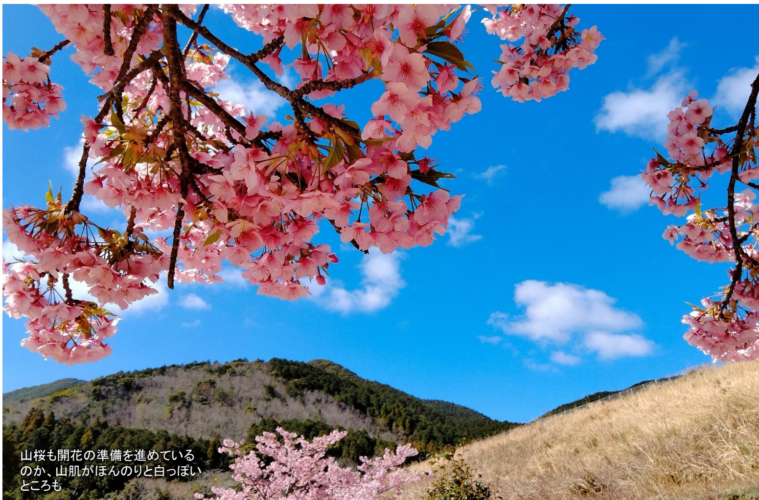
山桜も開花の準備を進めているのか、山肌がほんのりと白っぽいところも

<2月26日現在> 五島市心のふるさと市民 22,680人 22,222人突破！