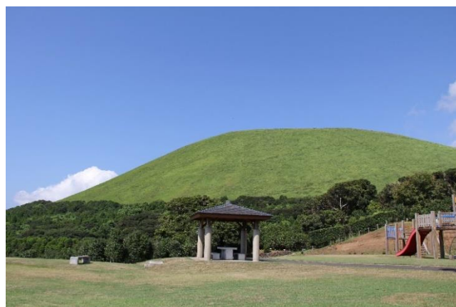
▲ 夏ごろの青々とした鬼岳

鬼岳の山焼きは景観の向上や害虫駆除のために数年に一度行われています。山焼きで真っ黒に変わった鬼岳も、これから新芽が出始め、数か月後には山全体が鮮やかな緑で覆われ、市民や観光客の目をまた楽しませてくれることでしょう。