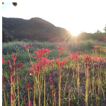
日陰など気温が上がりにくい所では多く咲いていることも