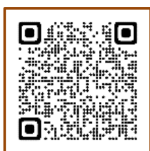
楽天ふるさと納税

鮮魚や五島牛、野菜や五島うどん… 魅力的な五島の品 がいっぱい！ のぞいてみてにゃ♡