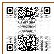
ふるさとチョイス

ポータルサイトは、寄附申込みからお支払いまでインターネットで便利にお手続きいただけます。