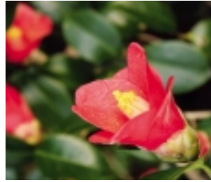
市の花木 ヤブツバキ