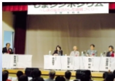
しまシンポジウム

平成23年8月19日(金)開催。県選出国會議員、長崎県知事、県内市町の首長ら約340人が参加。