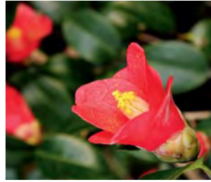
●市の花木 ヤブツバキ