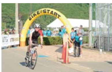
バラモンキング【三大スポーツイベント】 水泳+自転車+マラソン計226kmのタフなトライアスロン競技。