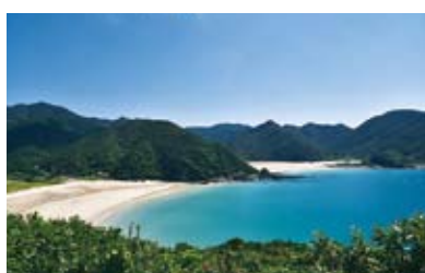
高浜【日本の渚百選、日本の水浴場88選】 日本一美しいといわれる砂浜を持つ、全国的にも有名な海水浴場。