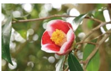
玉之浦椿 ヤブ椿の突然変異とされる幻の椿。五島市の玉之浦町が発祥の地。