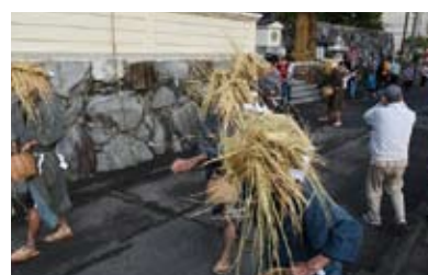
大宝の砂打ち【国選定無形民俗文化財】 浜の真砂を集落中に打ち撒き、悪霊・悪疫を払うとされている奇祭。