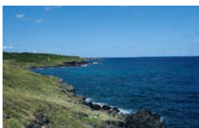
みみらくのしま【国名勝】 約6キロに渡る溶岩海岸と、草原が作り出す風光明媚な景観が美しい。歴史上、学術上の価値も高い。