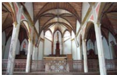
旧五輪教会堂【世界文化遺産】 外観は和風建築で、内部は本格的な教会建築様式。当時の教会建築を知る上で歴史的に重要な建造物。