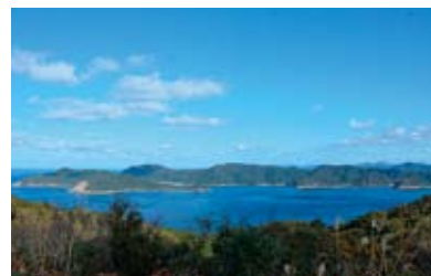
瀬戸を介した久賀島及び奈留島の集落景観【国選定重要文化的景観】 瀬戸越しに眺める、気候風土に則した海と島の集落景観。