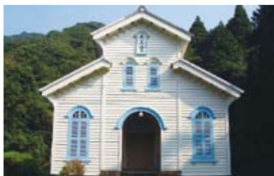
江上天主堂【世界文化遺産】 教会建築の名工 鉄川与助の代表作。 日本の木造教会のうち、完成度の高い作品として歴史的価値が高い。