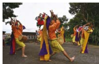
オーモンドー【国選定無形民俗文化財】 古い念仏踊り。初盆を迎える家とお墓で踊る。