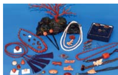
サンゴ 男女群島沖の希少価値の高いサンゴを加工。きめ細やかな、五島の伝統工芸品。