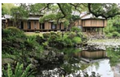
石田城五島氏庭園【国名勝】 福江島の玄関ともいえる福江城(石田城)の一角に、五島家第30代盛成公の隠殿(隠居所)として安政5年(1858年)に作られた。