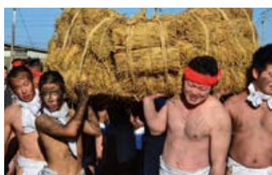
ヘトマト【国指定重要無形民俗文化財】 下崎山地区で行われる小正月の伝統行事。