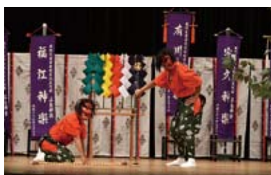
五島神楽【国指定重要無形民俗文化財】 五島列島各地で神職を中心に伝承されてきた神楽。室町時代から奉納があったとされている。