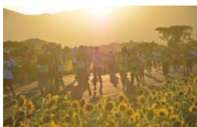
夕やけマラソン【三大スポーツイベント】 五島の夏の恒例イベント。島外参加者が3,000人超の大会。