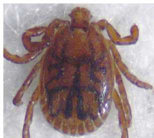
フタトゲチマダニ