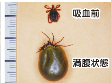
吸血前後のダニの様子