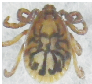
ヤマアラシチマダニ