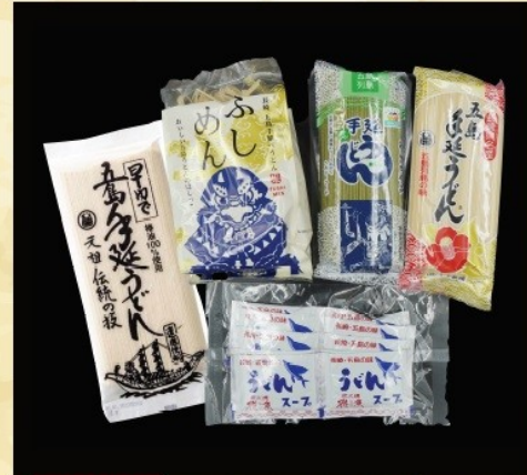
賞品番号⑤ 提供企業：五島市物産振興協会 うどんよりどりセット② 常温

梅うどん 300g、早ゆでうどん 300g、 ふしめん 300g、磯乾麺 280g、 うどんスープ 10g×10