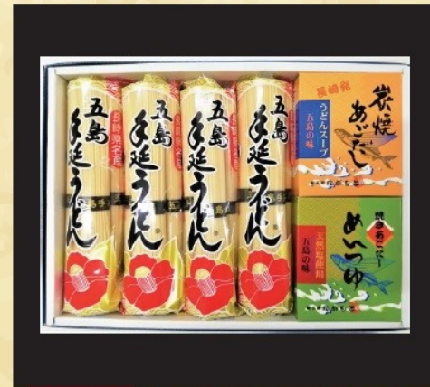
賞品番号③ 提供企業：中本製麺 五島手延べうどん梅と炭焼きあごスープ・めんつゆセット 常温

梅うどん 300g×4袋、炭焼きあごめんつゆ (希釈用) /1箱 (30g×6袋)、 炭焼きあごだし粉末スープ 1箱 (10g×8)