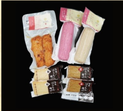
賞品番号⑦ 提供企業：五島市物産振興協会 島の練り物セット② 冷蔵

あじ巻き蒲鉾赤 1本、あじ巻き蒲鉾白 1本、 ピリ辛いかゲソ 2本、 ばらもん揚げ白 1枚×2、ばらもん揚げ黒 1枚×2