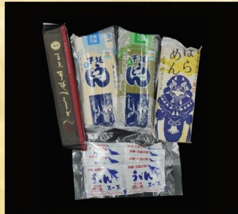
賞品番号④ 提供企業：五島市物産振興協会 うどんよりどりセット① 常温

ばらめん 300g、手延べうどんしげ 200g、 うどんスープ 10g×10、磯乾麺 280g、白乾麺 280g