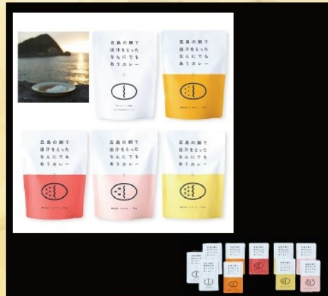
賞品番号⑧ 提供企業：五島市物産振興協会 五島の鯛で出汁をとったなんにでもあうカレー 10袋セット 常温