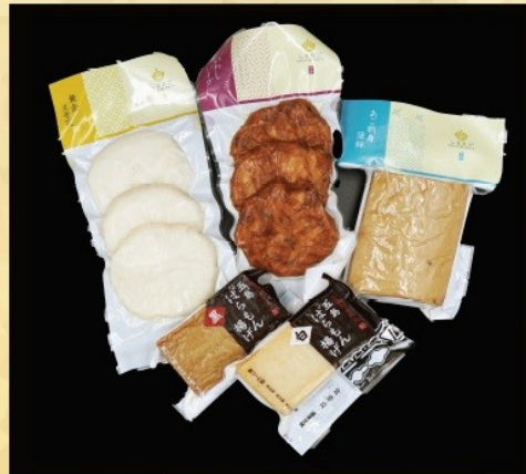
賞品番号⑥ 提供企業：五島市物産振興協会 島の練り物セット① 冷蔵

黄金えそ天 3枚入、あご刺し身蒲鉾 1本、 いわしバーグ 3枚入、ばらもん揚げ白 1枚、 ばらもん揚げ黒 1枚