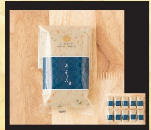
賞品番号② 提供企業：しまおう 島すりみ・あじ大容量 /1.8kg 冷凍