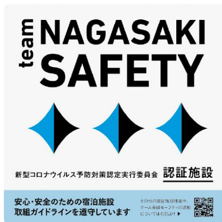
team NAGASAKI SAFETY