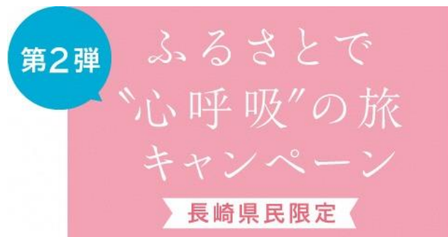
ふるさとで“心呼吸”の旅キャンペーン