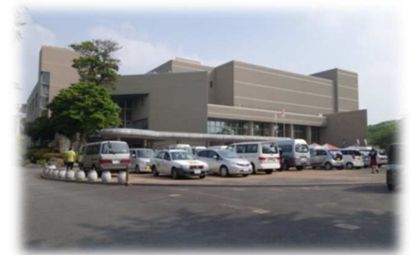
左側の建物が勤労福祉センターで、右側が福江文化会館です。

講座やサークル活動をとおして、 休日や余暇を教養・スポーツ・ レクリエーション等で楽しく学び、 くつろぐ施設です。