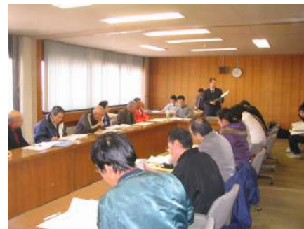
第3回委員会の様子 (委員会形式)