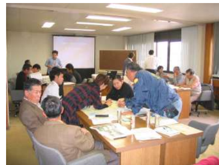
第1回委員会の様子 (ワークショップ形式)