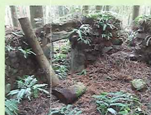
炭焼き場の跡 The remains of an old charcoal pit

The Tama-no-ura's flower is medium sized, with five to six petals, each red with a white edge. The original tree was discovered as a rare mutation near Mt.Tete-ga-take (461m) by a charcoal maker in the Tama-no-ura area in 1947. It was first displayed at the All-Japan Camellia Exhibition in Nagasaki City in 1973. The Tama-no-ura is now very popular among camellia enthusiasts around the world.