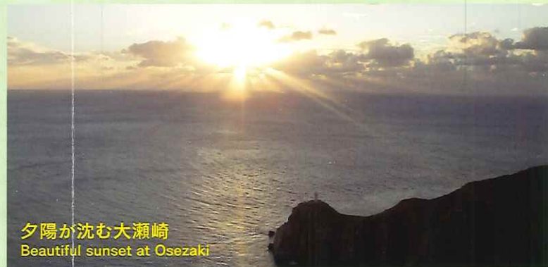
夕陽が沈む大瀬崎 Beautiful sunset at Osezaki

The Tama-no-ura's flower is medium sized, with five to six petals, each red with a white edge. The original tree was discovered as a rare mutation near Mt.Tete-ga-take (461m) by a charcoal maker in the Tama-no-ura area in 1947. It was first displayed at the All-Japan Camellia Exhibition in Nagasaki City in 1973. The Tama-no-ura is now very popular among camellia enthusiasts around the world.