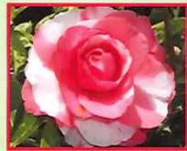
バレンタインデー Valentine Day