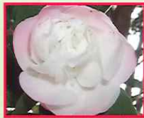
シナモン・シンディ Cinnamon Cindy