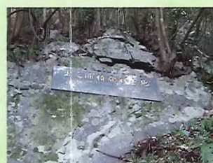
玉之浦椿発祥の地 The original site of 'Tama-no-ura' discovery

原木は五島市玉之浦町父ヶ岳(461m)の中腹で、昭和22(1947)年炭焼業者によって発見、昭和48(1973)年長崎で開催された全国ツバキ展に出展、幻の椿として、その子孫は世界の愛好者の注目を浴びている。