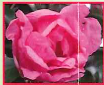
フラワーガール Flower Girl